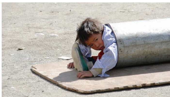
Дети, согнувшись и обхватив ноги руками, пролезали каким-то образом в таком положении через узкую трубу спиной вперед

Китайские и тибетские кварталы – это два абсолютно разных мира. Старые тибетские кварталы с тесными улочками всё еще несут в себе очарование древней культуры – маленькие белые домики, закулочные, сувенирные лавочки, сами простые тибетцы, часто в ярких одеждах из средневековья, в бусах и